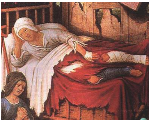
La fuerza de la peste en la Edad Media fue enorme. De nada servían los esfuerzos por limpiar las ciudades ni los buenos consejos para la salud.

4. No cabe duda de que la sumisión del hombre a la naturaleza se hace evidente con motivo de la aparición de grandes catástrofes tales como los incendios, las pestes, las inundaciones y sequías.