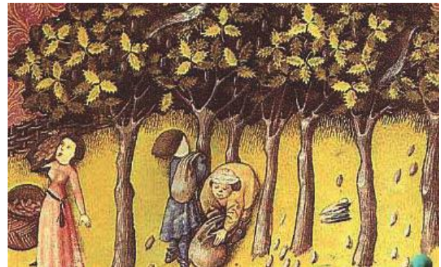
El paso de las estaciones permitía al hombre controlar el tiempo y realizar distintos tipos de faena agrícola

Se prohibía trabajar de noche porque existía la posibilidad de provocar un incendio debido a la escasa visibilidad.