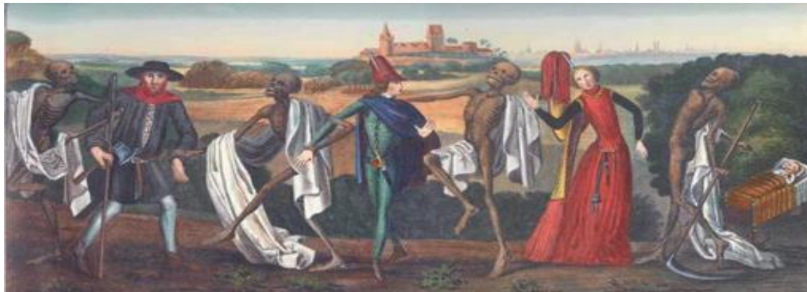
La peste afectaba a todos los hombres. No importaba ni la edad ni el sexo o la condición social. Por ello se la representa como una danza macabra.

Tan grandes eran las epidemias, como la Peste Negra en el siglo XIV, que muchos hombres las consideraban testimonio del Fin del Mundo.